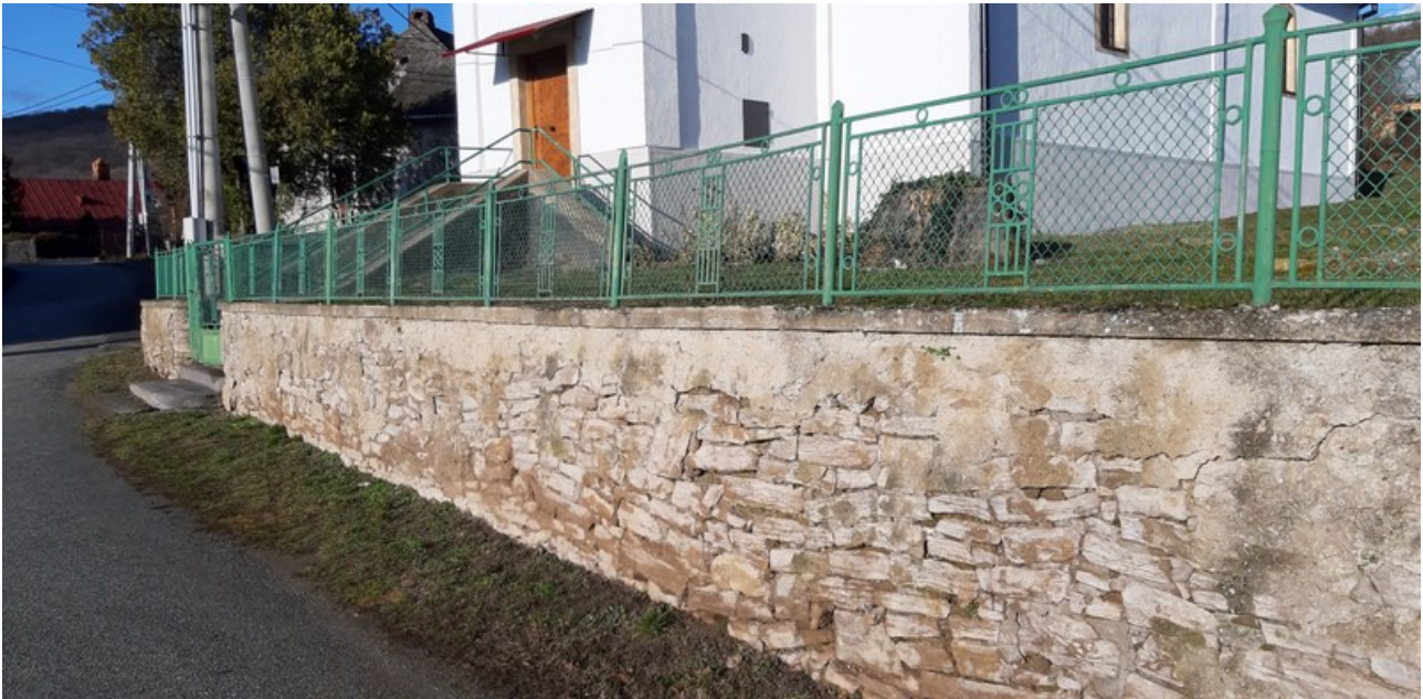
A felújításra váró támaszfal