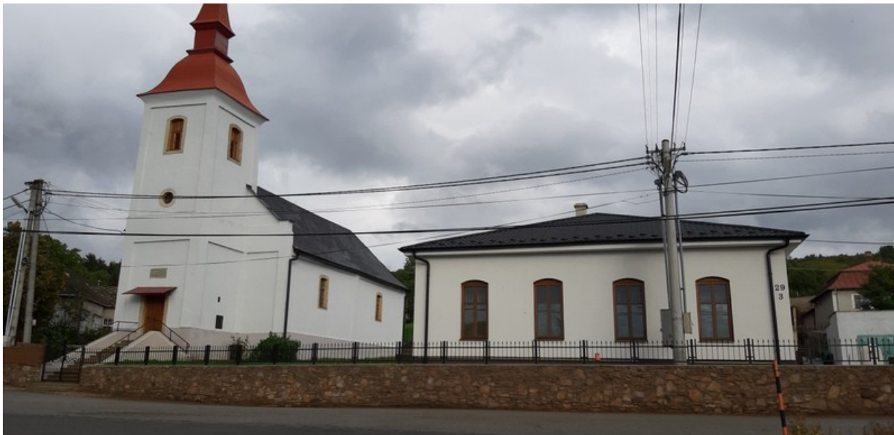
A templom és a parókia a kültéri felújítások után

Ezek a munkálatok többé-kevésbé több hónapon át folytak. Volt, hogy napokon át a tűző napon, s volt amikor esőben, sárban, de végül is hála legyen az Úrnak, hogy a határidő lejárta előtt sikerült befejezni a munkálatokat. A felújítási munkálatokat „A JE TO” - „ÉS KÉSZ” építkezés-felújításokkal foglalkozó cég végezte, amely korábban az egykori parókiát is újjávarázsolt az alkalmazottak szakmai tudásával és tehetségével, s közelben levő templomainkat is Kis- és Nagybáriban. A kovácsolt kapuk és kerítés a Töketerebes melletti kis községben élő kovács-mester keze munkáját dicséri.