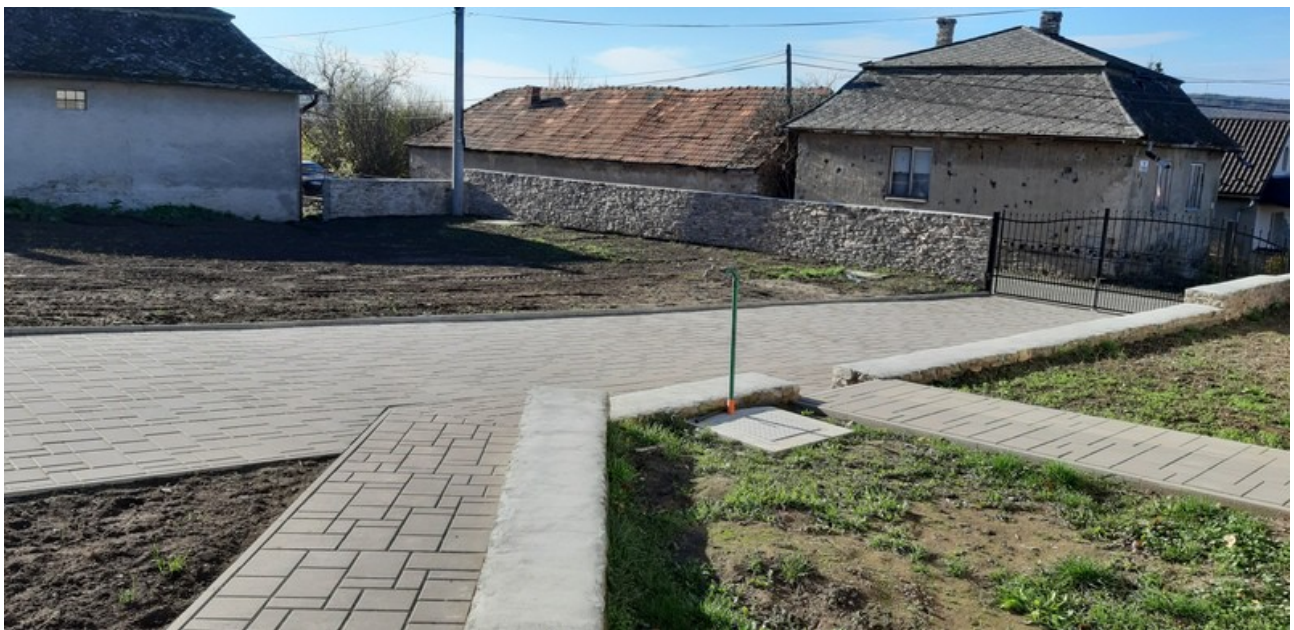
A felújított járda és a lerakott burkolatkövek a parókia udvarán