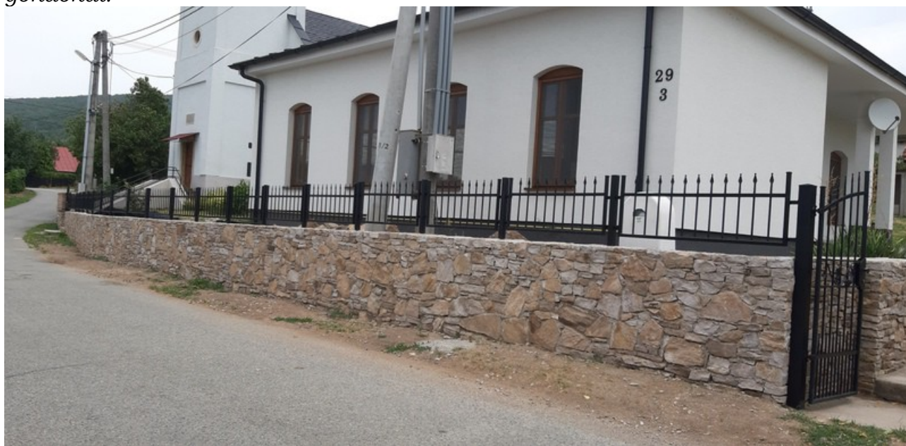
A templom és a parókia közötti új kovácsolt kerítés és a bejárati kiskapu

alakítva, ahol kisebb, de akár nagyobb járművek is megközelíthetik a templomot, ha ne adj Isten valami baj lenne, felújításra kerülne sor évek múlva, vagy akár kis kaszáló fűnyíró traktor is könnyen végezheti a környezetet szépítő munkákat. A templom és parókia mögötti földterület dimbes-dombos volt olykor gondot okozva a fű nyírásakor, illetve a terep kisebb kaszálóval való megközelítése során. Ezért a terep megfelelő rendezését is meg kellett oldani körös-körül, illetve a kialakítást követően annak fűmaggal való bevetését. Ezen munkálatoknál mind a gyülekezet elöljárói és tagjai aktívan kivették részüket. A parókia tetőzetének vízvezetése is átgondoltabban lett megoldva valóban úgy, hogy az ne okozhasson majd később gondokat.