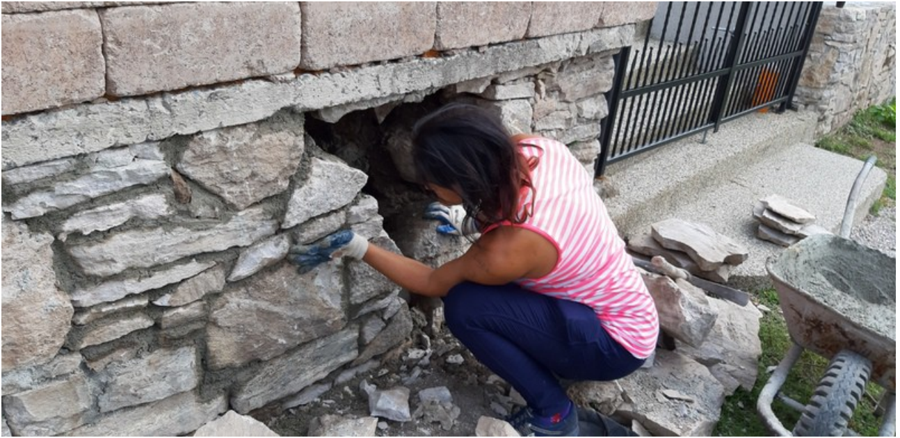
A korábban felújított kőfal újonnan való megépítése a templom előtt