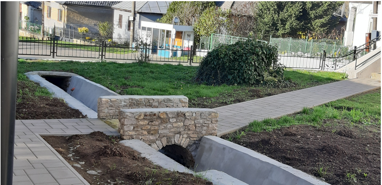
A templom és a parókia közötti járda és átjáró kis kőhíddal

Időközben a munkálatok kiterjedtek a templomot és a parókiát összekötő, valamint a parókia bejárati ajtajához vezető járdák kialakítására. A régi elbontásra került s új egymásba illeszkedő burkolatkő lerakására került sor nemcsak a járdákat illetően, hanem a parókia udvarát is, mely a gyülekezet előjáróinak döntése értelmében utólagosan, de szintén megvalósult.