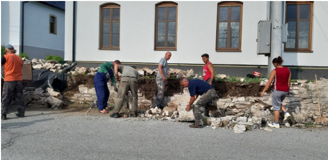
A korábbi támaszfal bontása közben

Végül is 2022 tavaszán sikerült megtalálni és egyeztetni azzal a Lelesz-i mesterrel, akit a Kerületi Műemlékvédelem Munkatársa ajánlott, hogy keressünk meg s próbáljunk meg tanácsot kérni tőle ez ügyben. A kőműves s kőfaragó-mester hitvestársával szívesen vállalták, hogy segítenek a templom és a parókia kőfalainak a teljesen újonnan való megépítésében s a mögötte levő vízelvezető rendszer megfelelő elhelyezésében.