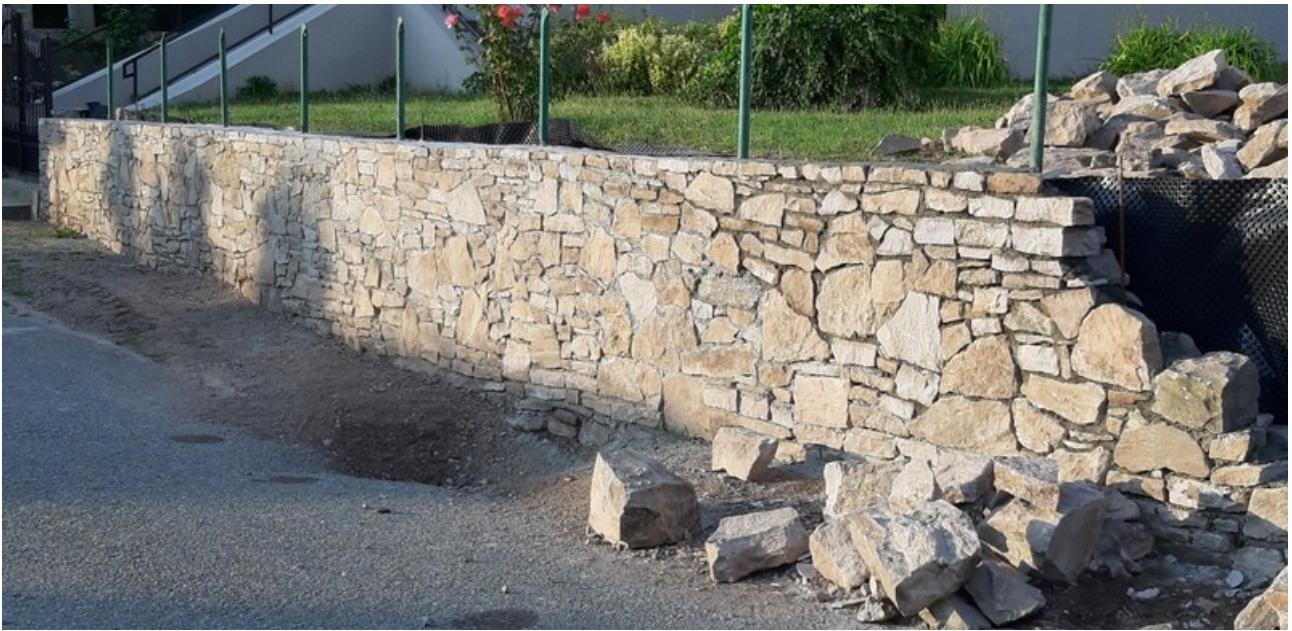
Az épülő támaszfal