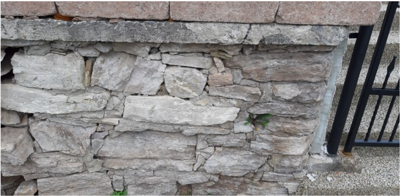
A kiékelte támaszfal kövei a felújítások után egy évvel

Ez az esztendő a várakozás ellenére arra volt jó, hogy meglássuk, hogy korábbi terveinket az előzetes elképzelések és meghagyások alapján nem folytathatjuk, ugyanis a több mint 50 méter hosszú támaszfal köveinek kiékelése sajnos nem elégséges, mivel a fal mögött föld van s ezen pedig az épületek (templom és parókia) s a föld pedig „dolgozik” a támaszfalban levő köveket fokozatosan szinte „kiveti/kinyomja” magából... s a falban levő elmállott kövek helyett újabbakat kell majd beszerezniük, mégpedig megfelelő mennyiségben és színárnyalatban. Nyilvánvalóvá vált számunkra az is, hogy olyan szakemberre lesz szükség ezen munkálatok elvégzésére, aki megfelelő szakmai tehetséggel, tehát tudással és kezűgyességgel bír majd, s aki ért a kövek faragásához és a fal megépítéséhez, így hát mindenek előtt olyan vállalkozást kellett a korábbi helyett keresniük, amelyben a környék legjobb szakemberei dolgoznak együtt már hosszú évek óta.