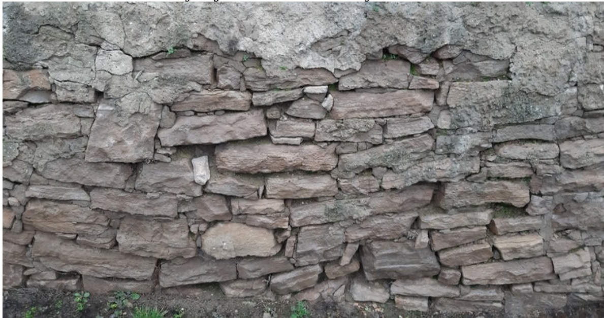
A támaszfal hiányos, kihullott fugája, meglazult kövei

Gyülekezetünk már több alkalommal is próbálkozott a református műemléktemplom és parókia előtti kőtámaszfal felújításához szükséges anyagiak biztosításával, megszerzésével. A kőből megépített támaszfal az 1920-as évekből való, s közvetlen a főút mentén található, mely állandóan ki van téve az arra elhaladó nemcsak a kisebb, de főleg a nagy terhekkal megrakott járművek által okozott rezgéseknek. Az időjárási viszonyok és a statikai terhelés következtében a támaszfal jelentősen megrongálódott és helyenként megdőlt, a kövek közötti fugák is több helyen kihullottak, s vannak helyek, ahol a kőfal kövei is hiányoztak és a stabilitása így már nem felelt meg a korábbi célnak. Ezért is vált sürgőssé felújításuk.