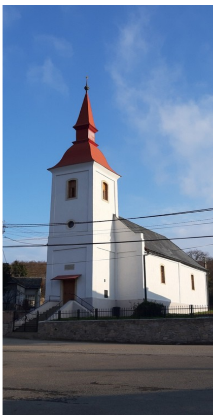
Csarnahó temploma a kültéri felújítások után