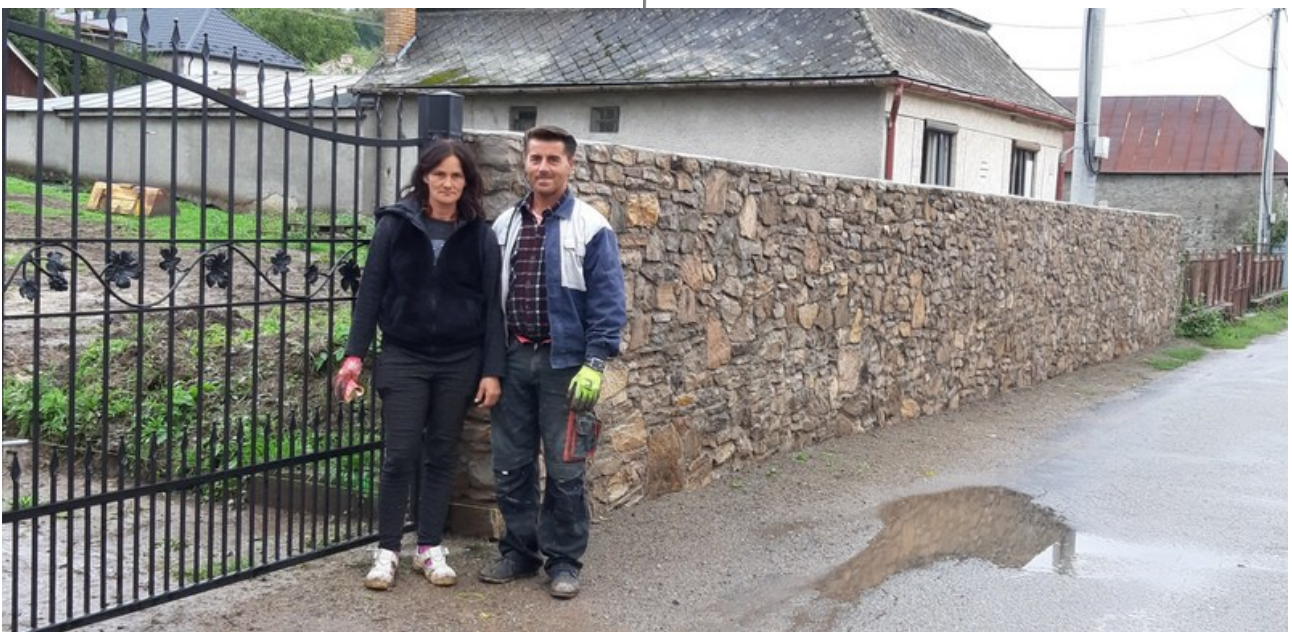
A kőfal újjáépítői a paróka bejáratánál

Ez az esztendő a várakozás ellenére arra volt jó, hogy meglássuk, hogy korábbi terveinket az előzetes elképzelések és meghagyások alapján nem folytathatjuk, ugyanis a több mint 50 méter hosszú támaszfal köveinek kiékelése sajnos nem elégséges, mivel a fal mögött föld van s ezen pedig az épületek (templom és parókia) s a föld pedig „dolgozik” a támaszfalban levő köveket fokozatosan szinte „kiveti/kinyomja” magából... s a falban levő elmállott kövek helyett újabbakat kell majd beszerezniük, mégpedig megfelelő mennyiségben és színárnyalatban. Nyilvánvalóvá vált számunkra az is, hogy olyan szakemberre lesz szükség ezen munkálatok elvégzésére, aki megfelelő szakmai tehetséggel, tehát tudással és kezűgyességgel bír majd, s aki ért a kövek faragásához és a fal megépítéséhez, így hát mindenek előtt olyan vállalkozást kellett a korábbi helyett keresniük, amelyben a környék legjobb szakemberei dolgoznak együtt már hosszú évek óta.