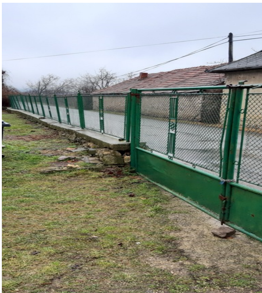
A megrongálódott kőfal, kapu és kerítés egy része

Az újkori kovácsolt kerítés és a vaskapuk ideje is lejárt, helyenként a rozsdá- ette és a korábbi karbantartások, javítások ellenére a kapuk is „szélirányban ingadoztak”. A templomot és a parókiát körülvevő drót-kerítés is elévült,