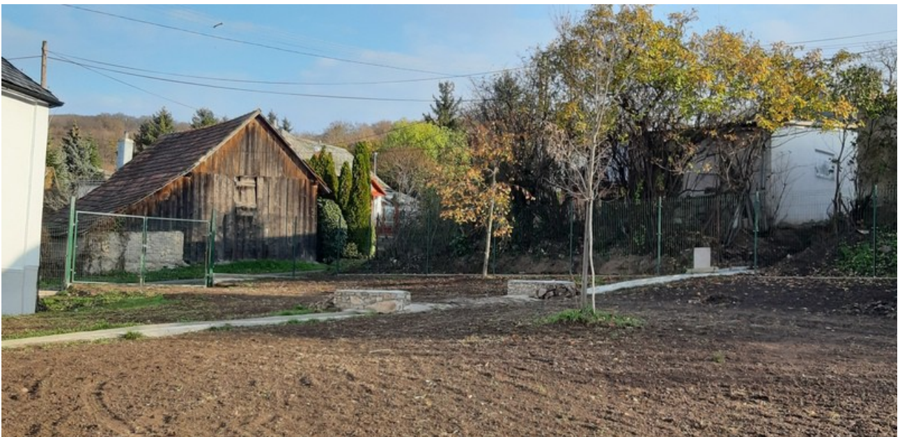
A templom és parókia hátsó kerítése bejárati kapuval kialakítva

Időközben a munkálatok kiterjedtek a templomot és a parókiát összekötő, valamint a parókia bejárati ajtajához vezető járdák kialakítására. A régi elbontásra került s új egymásba illeszkedő burkolatkő lerakására került sor nemcsak a járdákat illetően, hanem a parókia udvarát is, mely a gyülekezet előjáróinak döntése értelmében utólagosan, de szintén megvalósult.