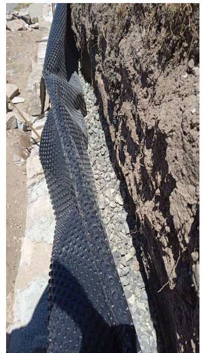
A támaszfal mögötti rész vízelvezetése

A helyi gyülekezet gondnoka, presbiterei és a gyülekezet ifjai is számos alkalommal szívesen jöttek és segítettek a régi kőfal elbontásában, s az újonnan beépítendő kövek megfelelő mennyiségben való biztosításában, amelyet egy külföldön élő helyi tulajdonos ajánlott fel a nemes célra miután leégett mellék-gazdasági épületének a tetőzete. A színárnyalatban azonos színű kövek alakját a kőművesmester formálta a kezében levő érzék alapján mindaddig, amíg az végül is a megfelelő helyre került. Csak a templom és a parókia előtti kőfal a főút mentén több mint 50 m hosszú s ezenfelül sor került még az ún. befelé, a parókia utolsó pilléréig vezető s a telek végét jelölő falak megépítésére, valamint a templom és a parókia között végighúzó árok felett a megfelelő átjáró, s a majdani munkálatok során gépjárművek számára az áthaladást biztosító átjáró kialakítására is,